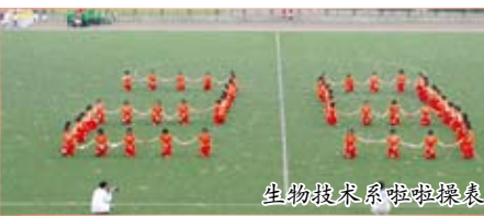
生物技术系啦啦操表演