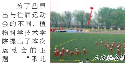
人文社会科学系啦啦操表演