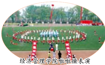
经济管理学院啦啦操表演