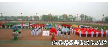
植物科技学院方队表演