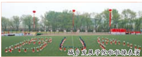
城乡发展学院啦啦操表演