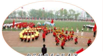
食品科学系方队表演