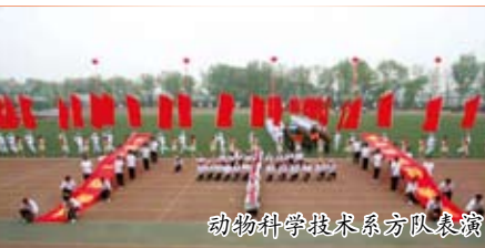
动物科学技术系方队表演

京奥运之风，迎祖国六十华诞，展北农师生风采”。并在全校范围内征集第29届运动会会旗，动员全校师生为运动会设计出一款富有激情、富有创新、新颖独特、内容积极向上、充满运动气息的会旗。共征集了二十余种富有新意的会旗，最后经过学校领导及体育运动委员会商讨，将“农”字旗做为最后的会旗方案。