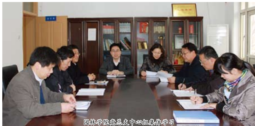
园林学院党总支中心组集体学习

园林学院在建设学习型党组织过程中以创先争优活动为契机，充分发挥领导干部的带头作用、广大党员的主体作用，取得良好效果。园林学院党总支以“三育人”、“先进党支部”、“优秀教研室”等评选工作为载体，充分发挥优秀党员的先锋模范作用，营造热爱教育事业、忠于职守、为人师表、团结协作的良好风尚。