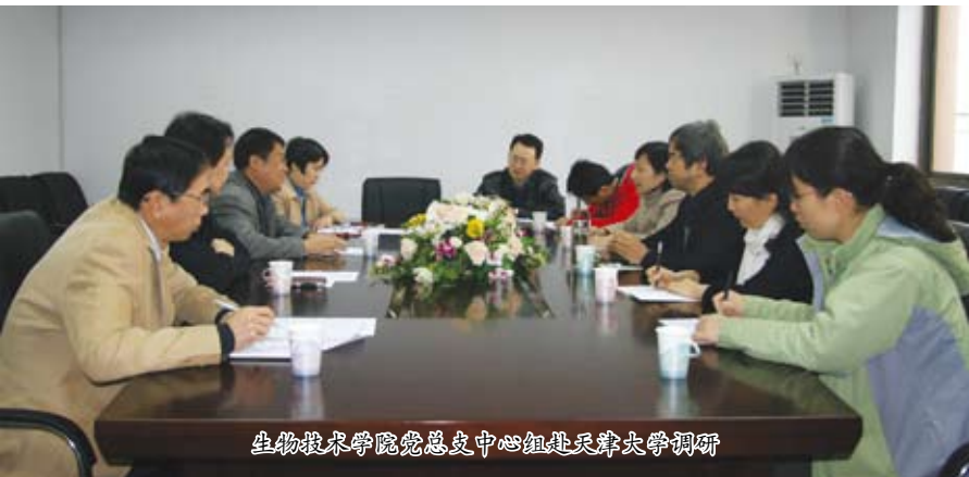
生物技术学院党总支中心组赴天津大学调研

建设马克思主义学习型政党，关键是各级党组织成为学习型党组织、各级领导班子成为学习型领导班子。2009年4月，生物技术学院成立了党总支理论学习中心组。两年来，中心组深入开展理论学习，积极进行调查研究，坚持学以致用，不断提高思想理论水平、政治业务素质和工作能力。