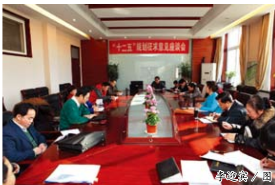
李迎宾 / 图

《通知》指出,征求意见时间为3月1日至3月31日。师生可将意见、建议通过电子邮件反馈至联系人,也可以以书面形式投放于办公楼大厅意见箱内。各二级学院负责人及领导班子成员要高度重视、认真组织,并于3月31日前将本单位意见统一整理后以书面形式报送至党政办公室。