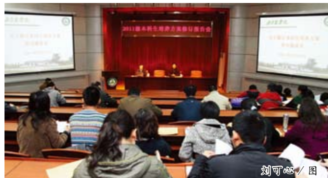
刘可心 / 图